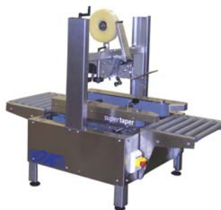
Empaquetadora Semiautomática Supertaper ST1M