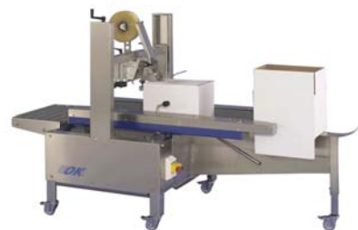
Empaquetadora Supertaper ST1M con Estación de Empaque