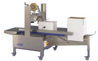
Supertaper ST1M Verpackungsmaschine mit Verpackungsstation