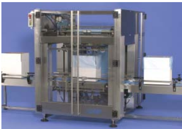
OK-220 Bag - in - Box

Als gevolg van de voortgaande technische ontwikkelingen zijn wijzigingen niet uitgesloten, derhalve kunnen aan dit document geen rechten worden ontleend.